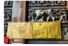
臺南、高雄二位國寶級