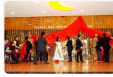
台中新社「明月居博物